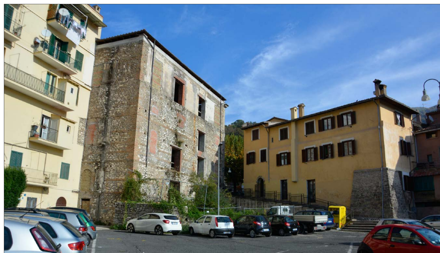
VISTA 4 ANTE OPERAM _ PROSPETTI SUD - OVEST SU PIAZZA TOZZI