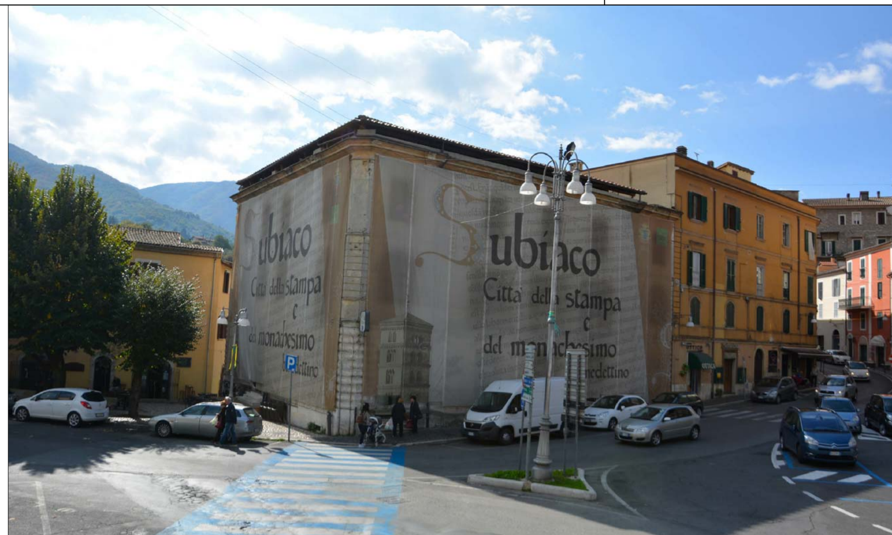
VISTA 1 ANTE OPERAM _ PROSPETTI NORD - EST SU VIA CAVOUR E PIAZZA ROMA