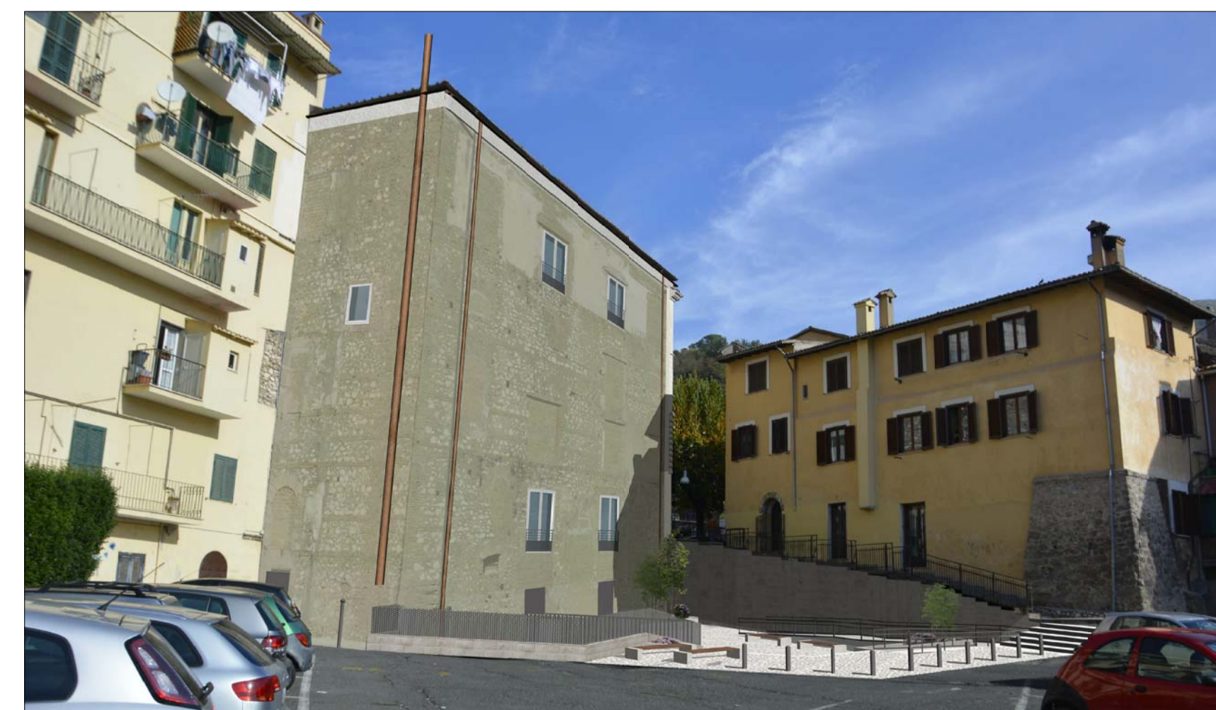
VISTA 4 POST OPERAM _ PROSPETTI SUD - OVEST SU PIAZZA TOZZI