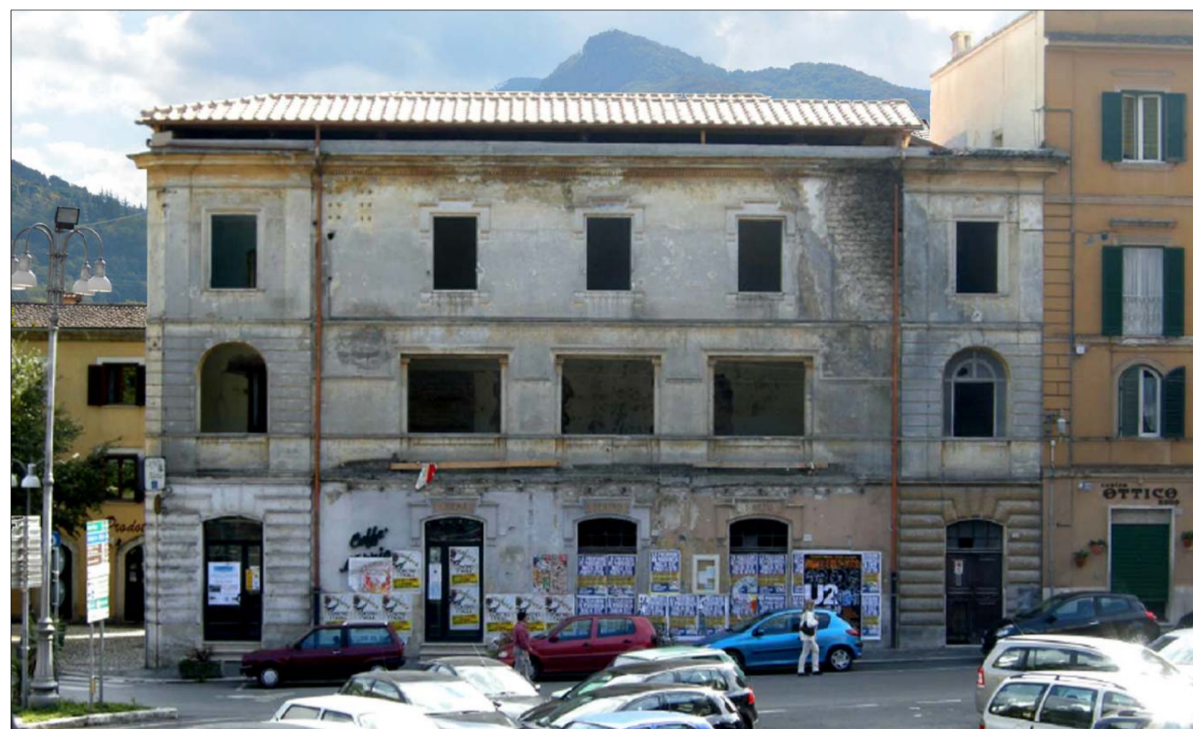
VISTA 2 ANTE OPERAM _ PROSPETTO NORD SU VIA CAVOUR