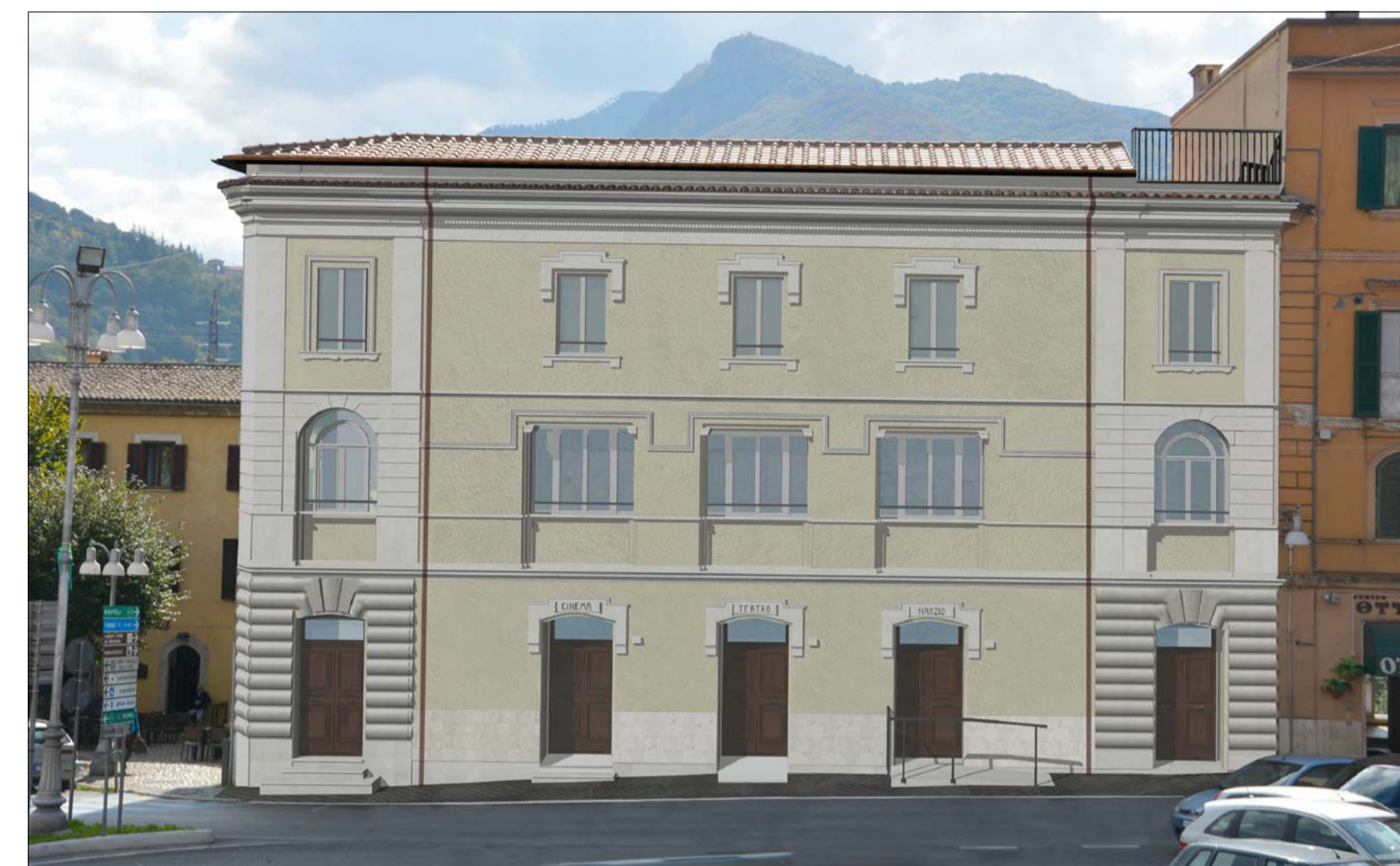
VISTA 2 POST OPERAM _ PROSPETTO NORD SU VIA CAVOUR