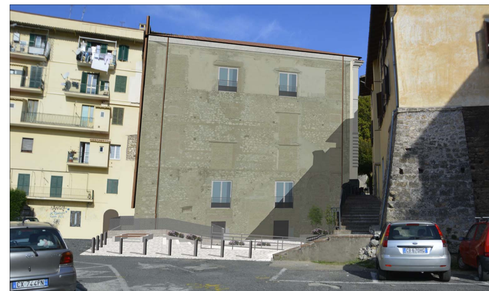
VISTA 3 POST OPERAM _ PROSPETTO SUD SU PIAZZA TOZZI