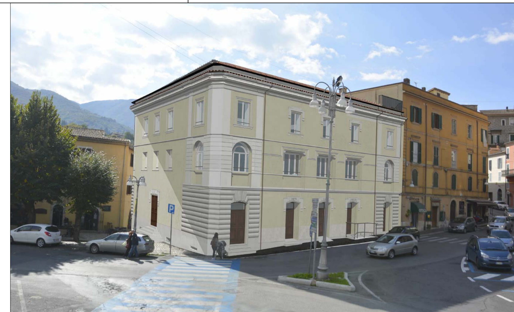
VISTA 1 POST OPERAM _ PROSPETTI NORD - EST SU VIA CAVOUR E PIAZZA ROMA