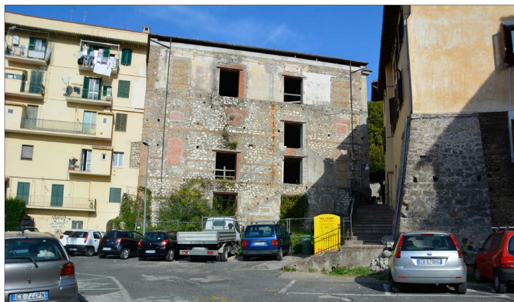
VISTA 3 ANTE OPERAM _ PROSPETTO SUD SU PIAZZA TOZZI