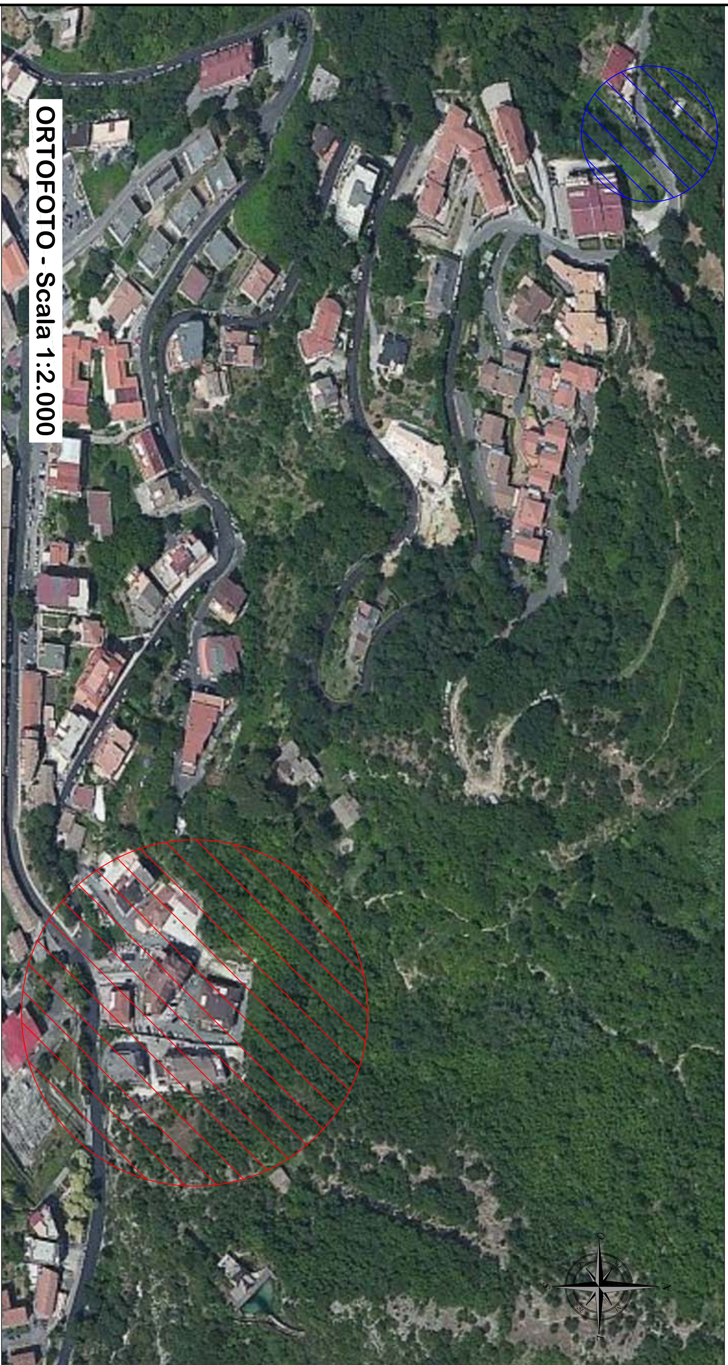
ORTOFOTO - Scala 1:2.000