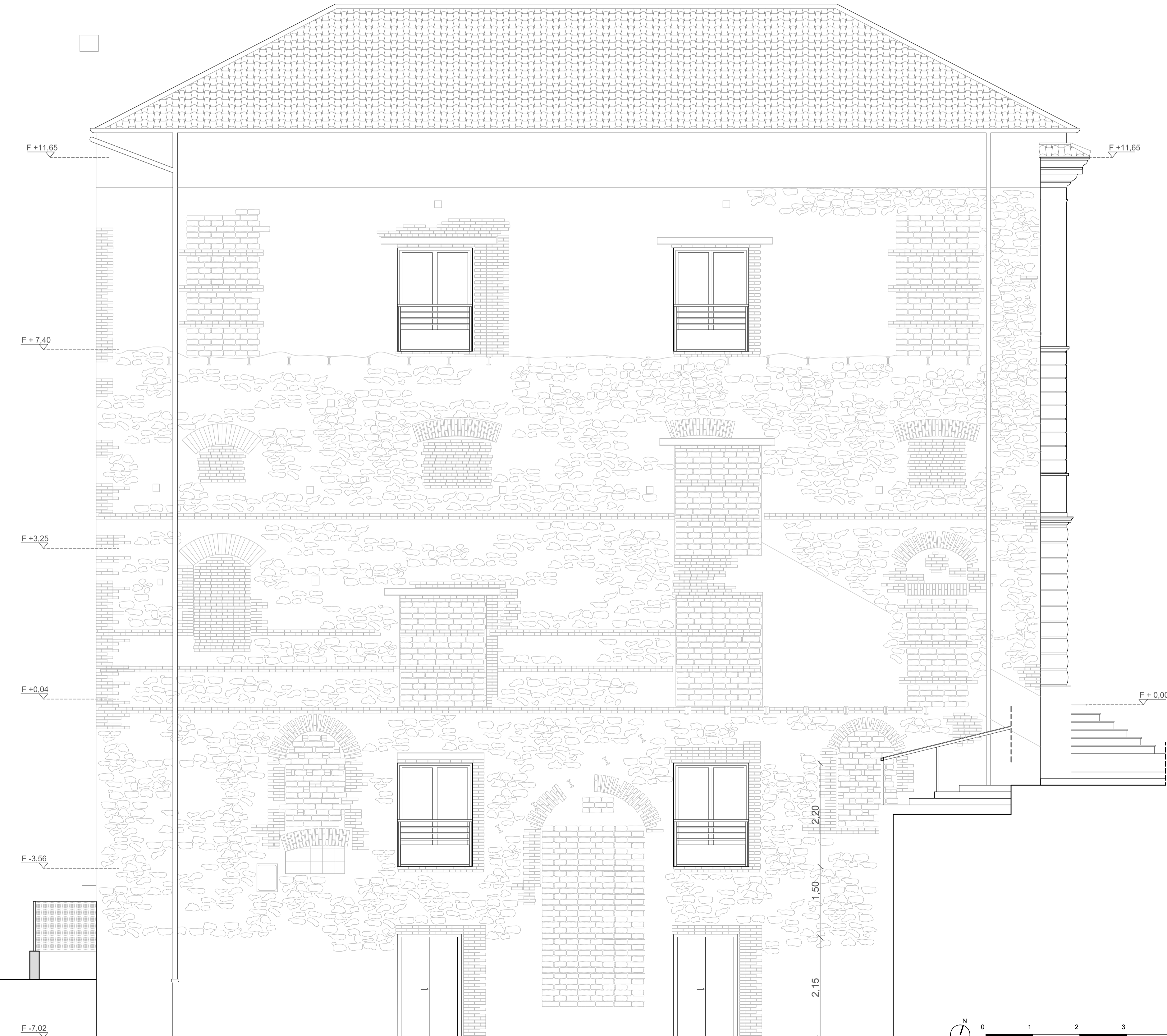
FACCIATA RESTAURATA PROSPETTO SUD, SCALA 1:50