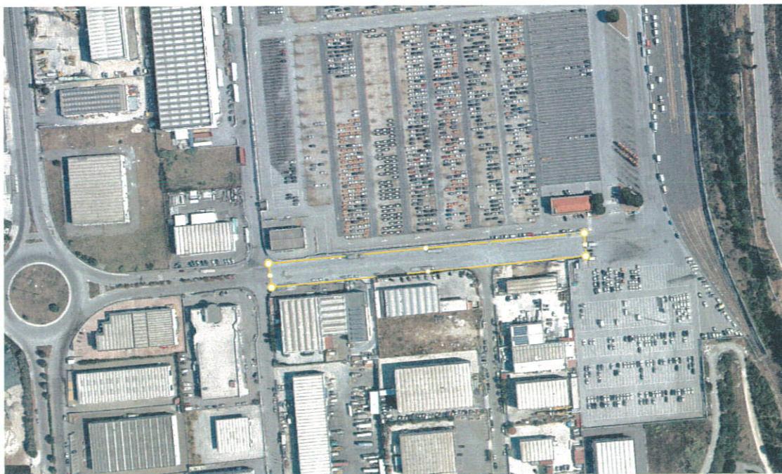
Fig. 2 – via Ferri