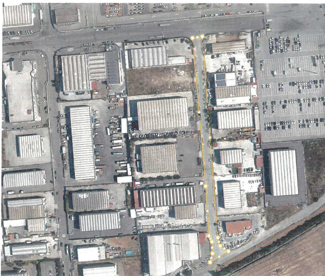
Fig. 3 – via Nenna