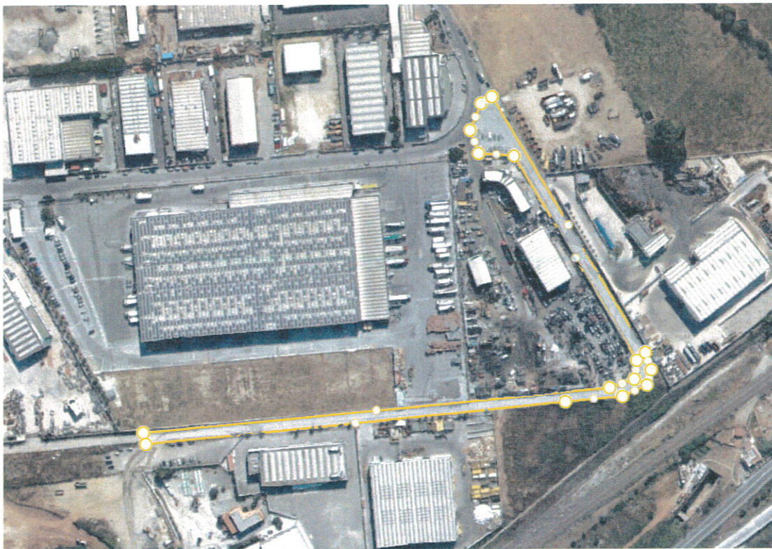
Fig. 1 – Via Bonucci