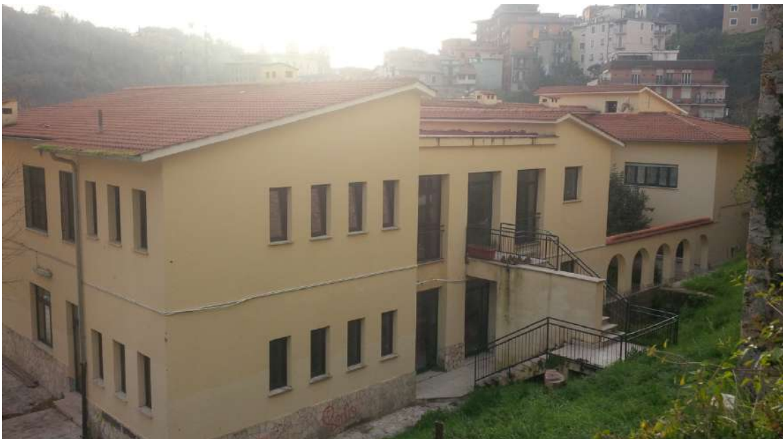
Vista retro_Scuola Elementare_Corpo_A