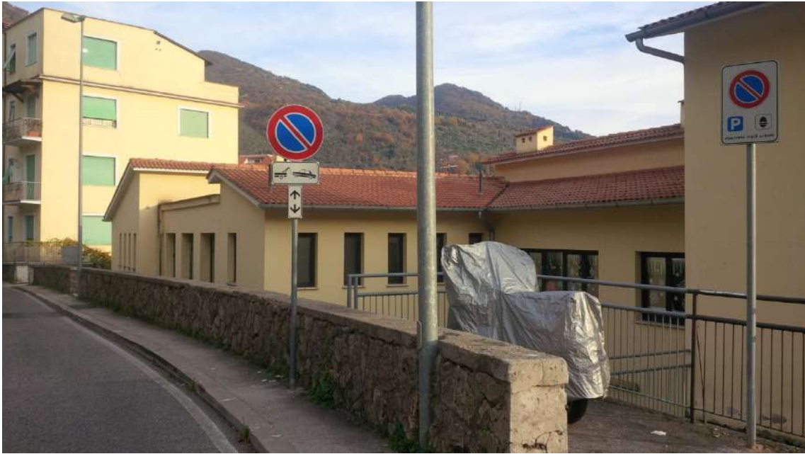
Vista da Viale Antonio Fogazzaro_Scuola dell'Infanzia_Corpo_B