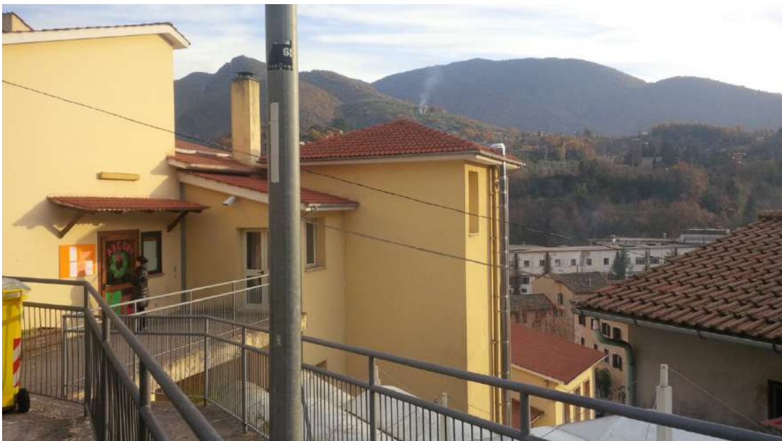
Vista da Viale Antonio Fogazzaro_Scuola dell'Infanzia_Corpo_B