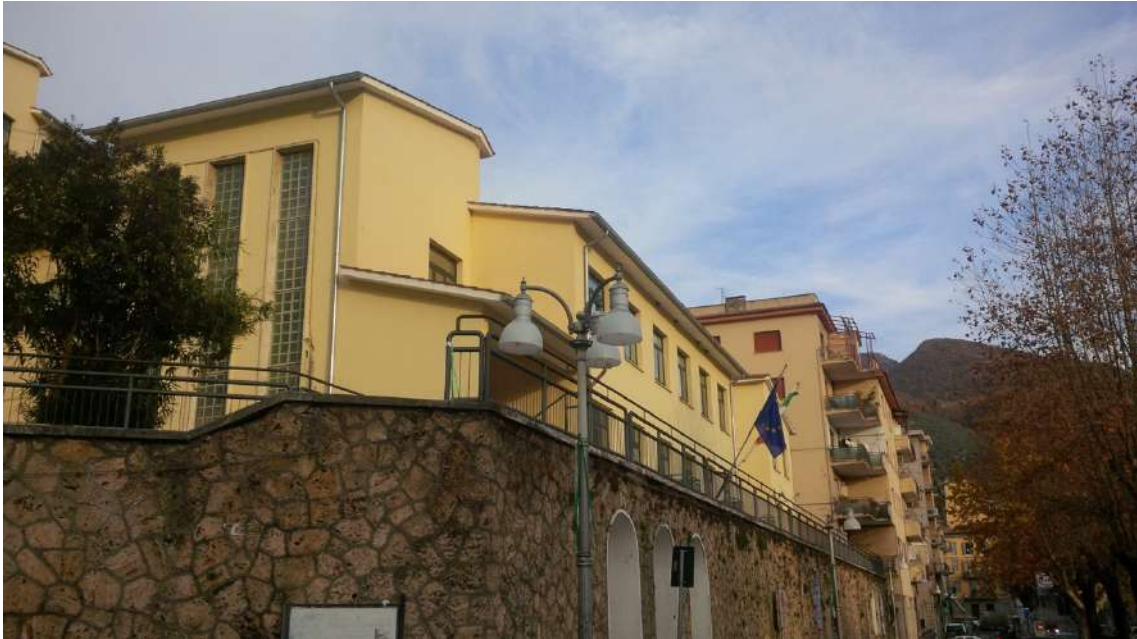
Vista da Piazza del Campo_Scuola Elementare_Corpo_A