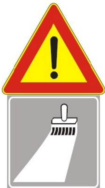
Figura II 391 Art. 31