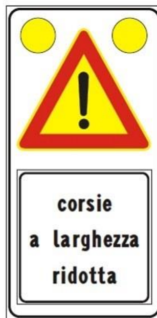
Figura II 391c Art. 31