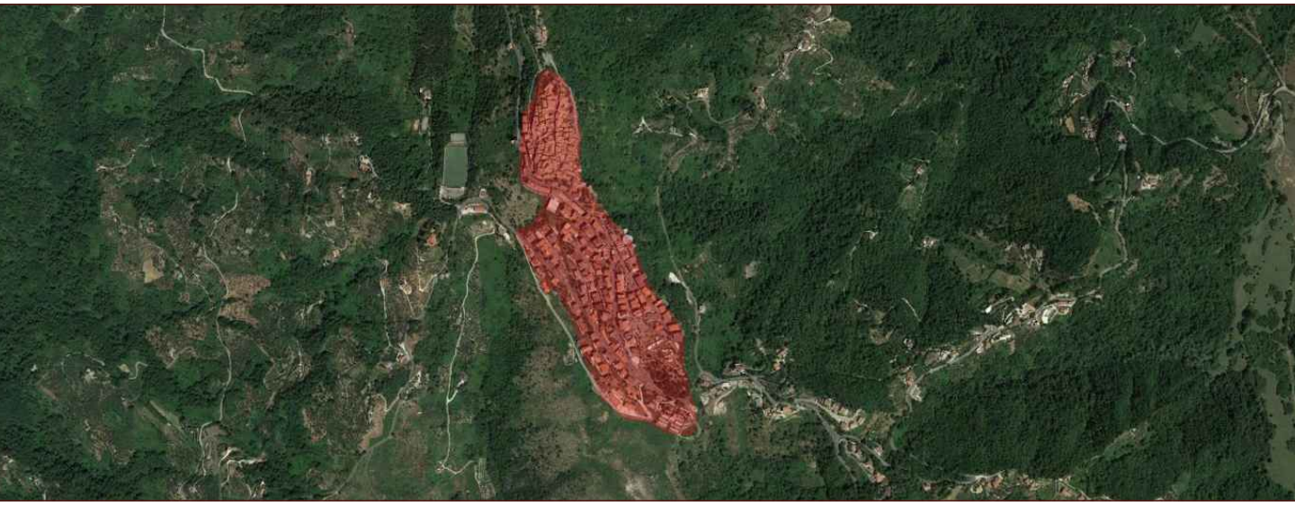
VISTA AEREA Strada interessata dall'intervento