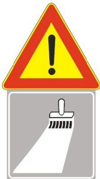
Figura Il 391 Art. 31