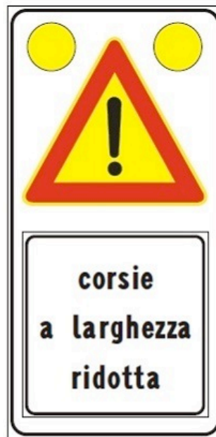
Figura Il 391c Art. 31